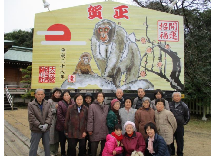
家内安全 開運招福